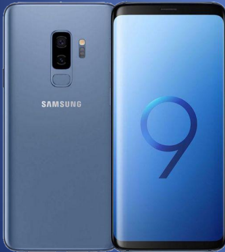
Color: negro gris y lila