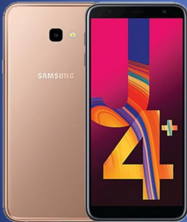
Color Dorado y negro.