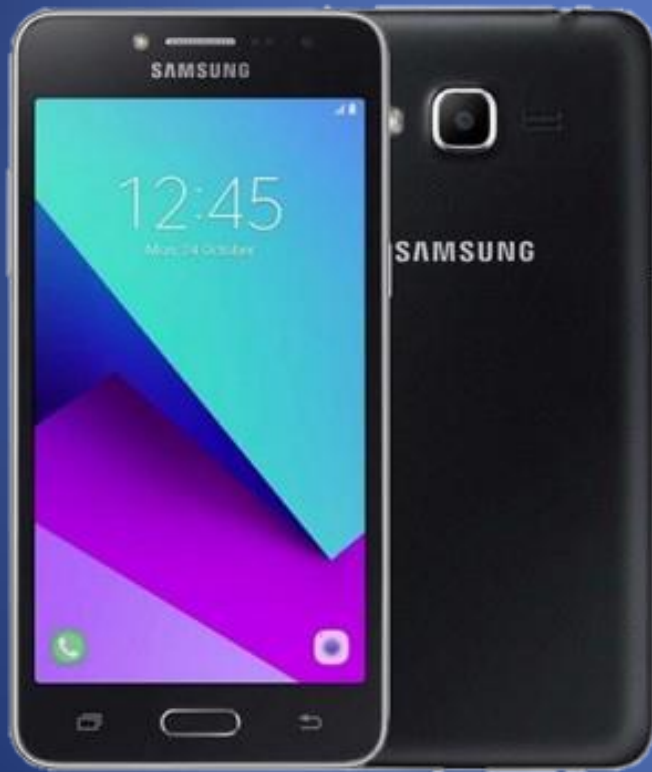
Colores negro y plateado