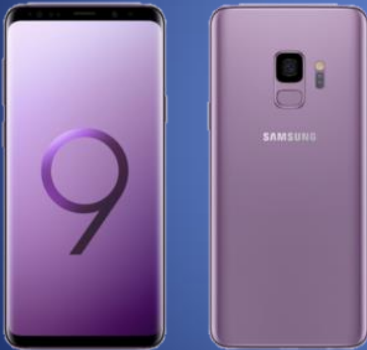
Color: negro gris y lila